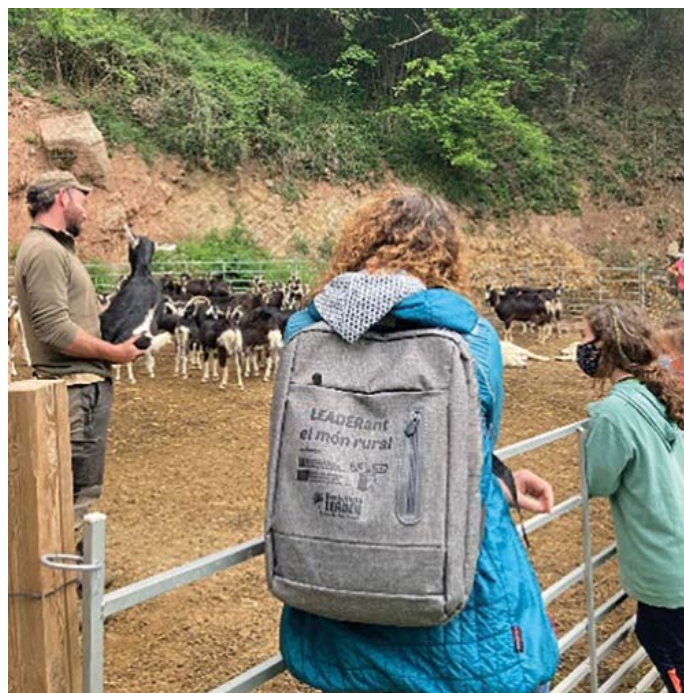
Visita a l'explotació La Vall, a Sant Pere de Torelló.

Les actuacions del projecte consisteixen en la promoció de productes locals com ara la carn de vedella, els làctics i formatges, la carn de xai i cabrit, la trumfa de la vall de Camprodon i la patata d'Orís, la carn de poltre i els embotits, entre d'altres.