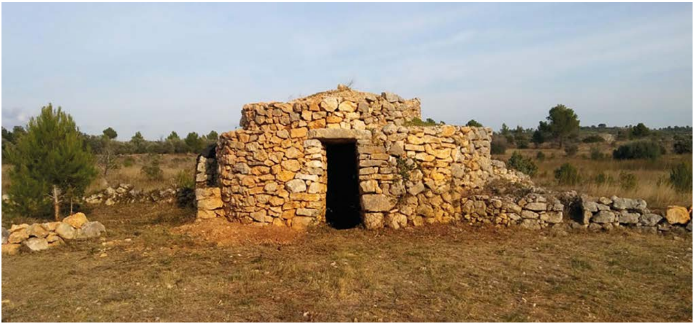
Barraca LLE-32 de la Garriga d'Empordà, una barraca restaurada l'any 2012 en el marc de les "Jornades de recuperació del patrimoni", organitzades per l'Associació per a la defensa i protecció de la Garriga d'Empordà i amb la col·laboració de l'associació Via Pirena.