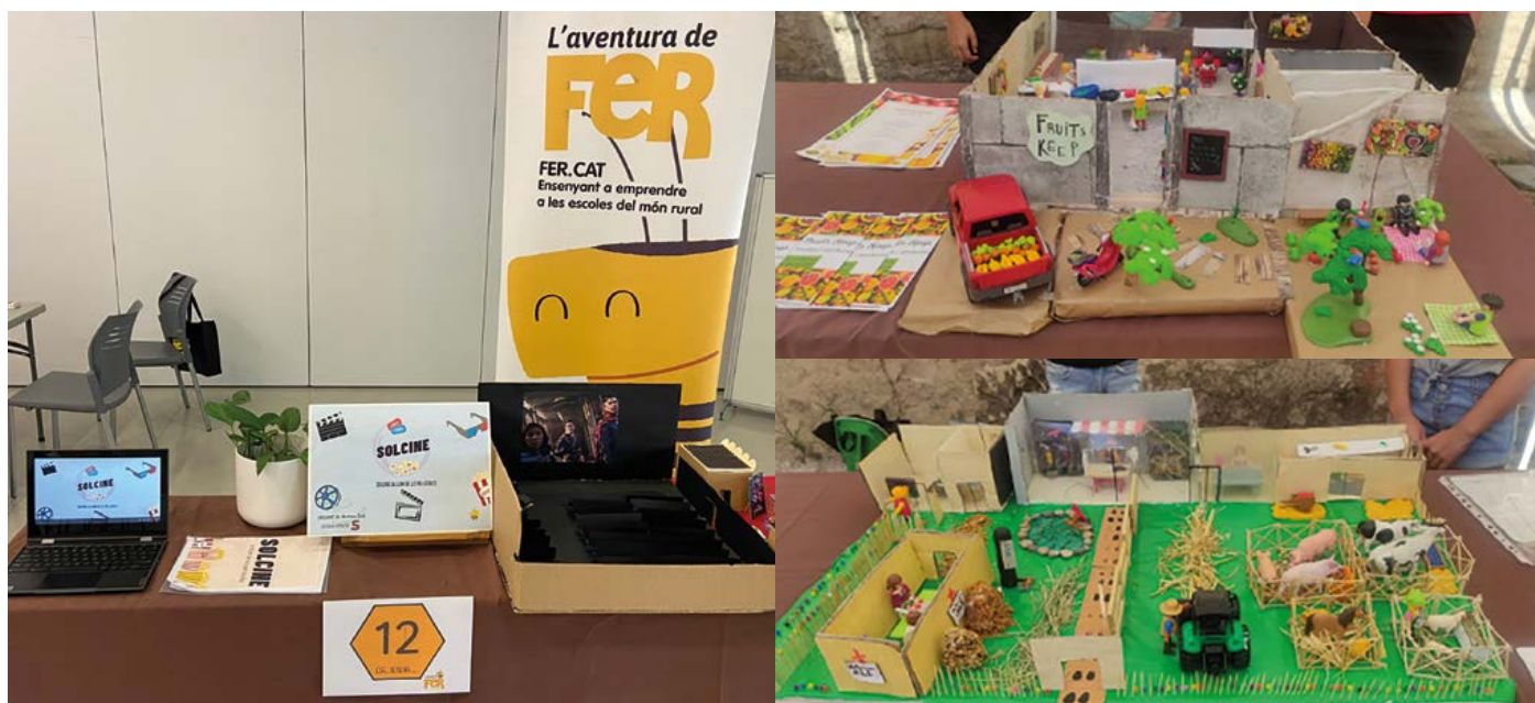
Collage d'imatges dels projectes emprenedors exposats a les fires "FER".