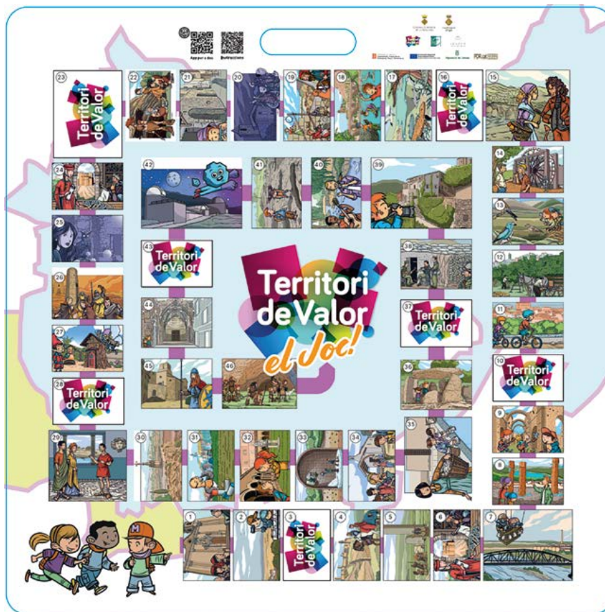
Joc de l'oca de Territori de valor, dissenyat per Ramon Mayals.

En el procés participatiu, es va detectar que som un territori desconegut, però amb moltes potencialitats, i es va considerar que el turisme familiar pot ser un públic objectiu apropiat, tant pels recursos que tenim al territori com per les infraestructures turístiques de les que disposem. Dirigir-se als nens i als joves i fer que coneguin el territori afavoreix la continuïtat dels atractius turístics i l'aflorament d'oportunitats a través d'aquests recursos.