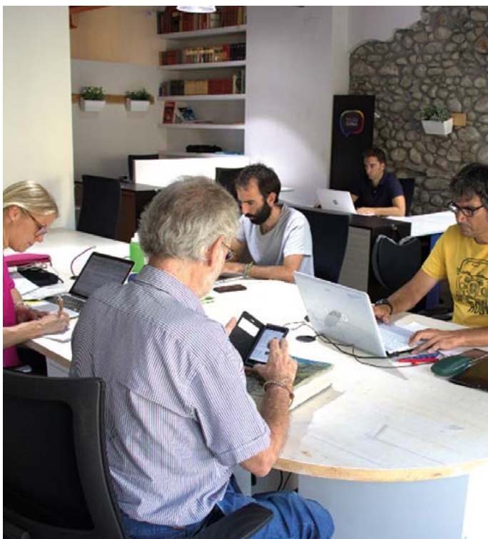
Espai de coworking "Palau Cowork" de La Seu d'Urgell .