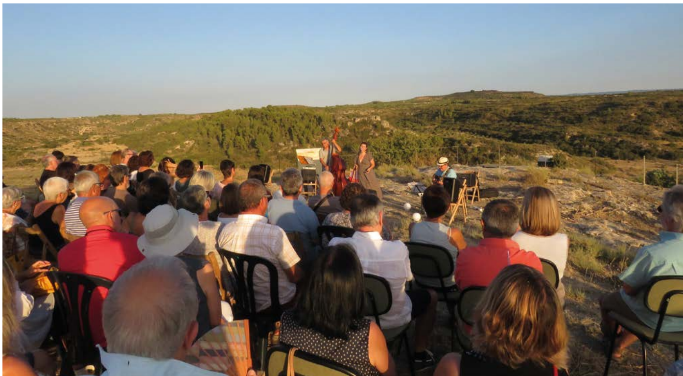
Acte del projectes Espais naturals de ponent.