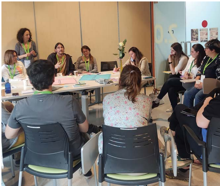
Jornada Talent jove.

La conservació del patrimoni natural i cultural i el canvi climàtic són dos reptes que tenen un impacte molt gran en l'àmbit social, cultural i mediambiental. Per donar-hi resposta, la cooperació catalana ha desenvolupat els projectes següents: ENFOCC, que treballa per la transició energètica, la gestió forestal, la mobilitat sostenible i la mitigació i adaptació al canvi climàtic; LEADER Natura, que desenvolupa una eina de