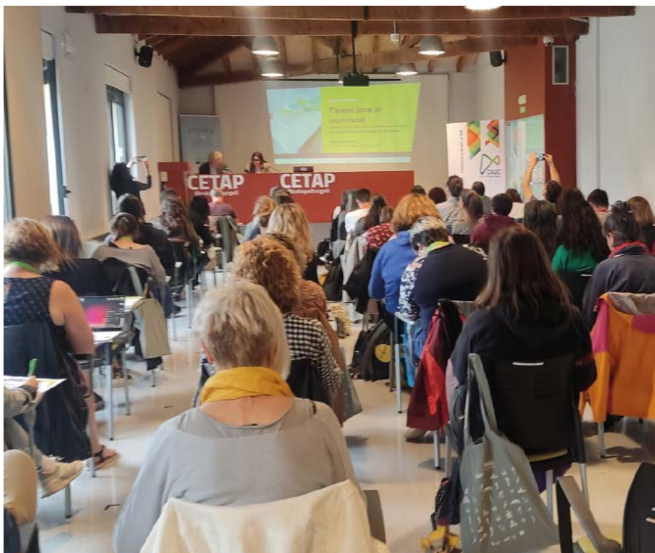
Auditori del Centre empresarial i tecnològic de l'Alt Pirineu (CETAP). La Seu d'Urgell.