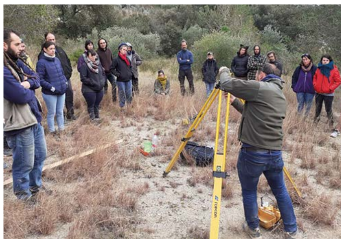
Sessió de pràctiques d'agricultura regenerativa.

La principal missió d'aquest projecte és dissenyar i executar accions que contribueixin a dinamitzar, desenvolupar eines útils, intercanviar informació i establir taules de diàleg que permetin obrir oportunitats econòmiques per als municipis rurals de la zona d'actuació del Consorci en els àmbits energètics, paisatgístics i que donin valor a l'agricultura, tant des del punt de vista de la producció com pels valors immaterials del paisatge agrícola.