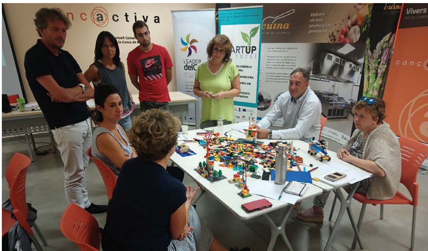
Jornada Design Thinking.