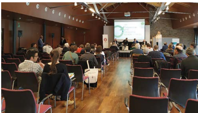
Participació a la jornada de l'Observatori de l'Economia Circular celebrada al Món Sant Benet (Sant Fruitós de Bages) el setembre de 2018.