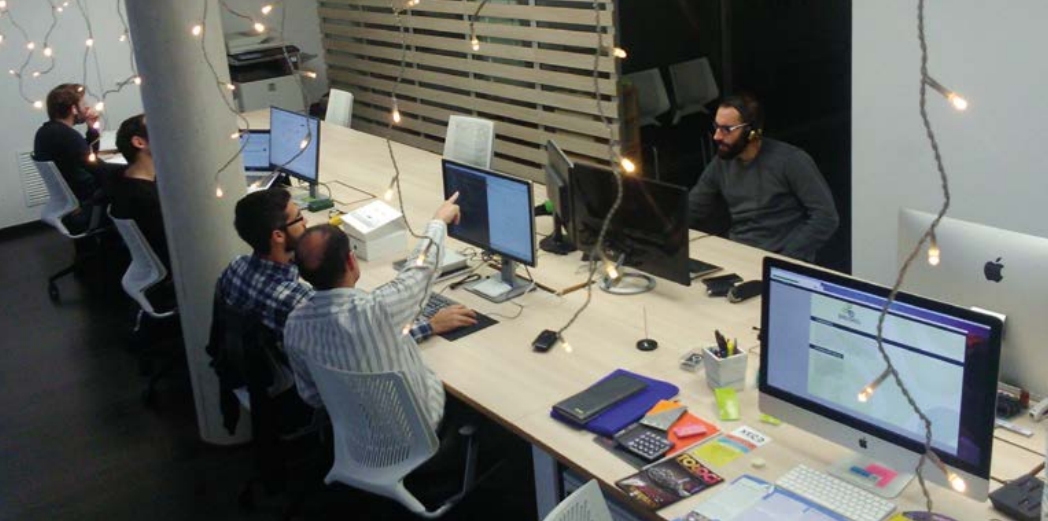
Espai de coworking rural.