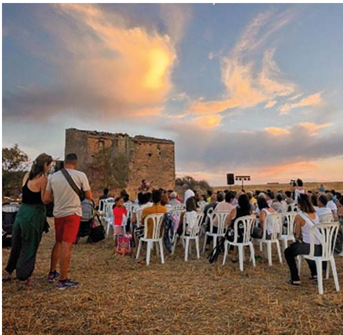
S'han realitzat 193 activitats de tots tipus (culturals, esportives de baix impacte, naturalístiques i de valor patrimonial).