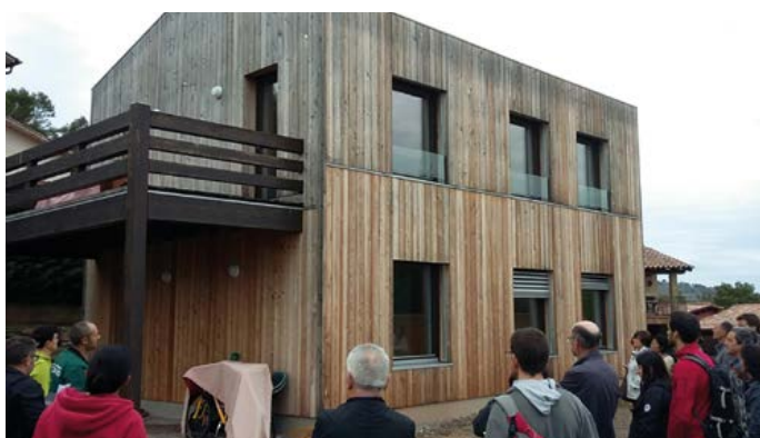
Jornada de coneixement de les passivhàuser al Moianès.