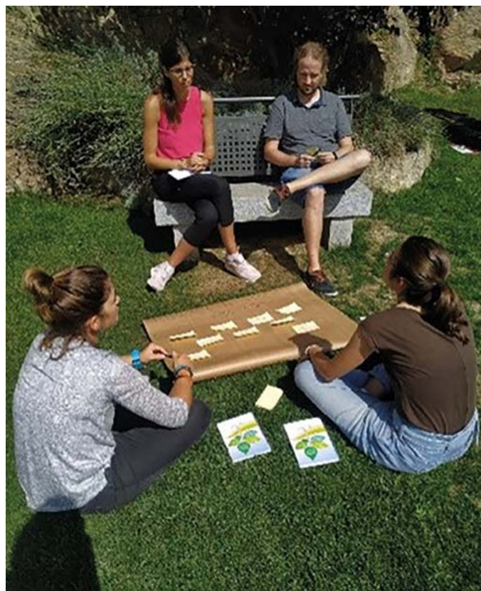
Dinàmica d'intercanvi d'experiències entre personal tècnic dels grups LEADER i de la xarxa de professionals de Joventut. Jornada tècnica de talent jove a les comarques rurals, territoris d'acollida. (Prullans, setembre de 2019).

serveis de les zones rurals per a la construcció del projecte de vida en aquests territoris.