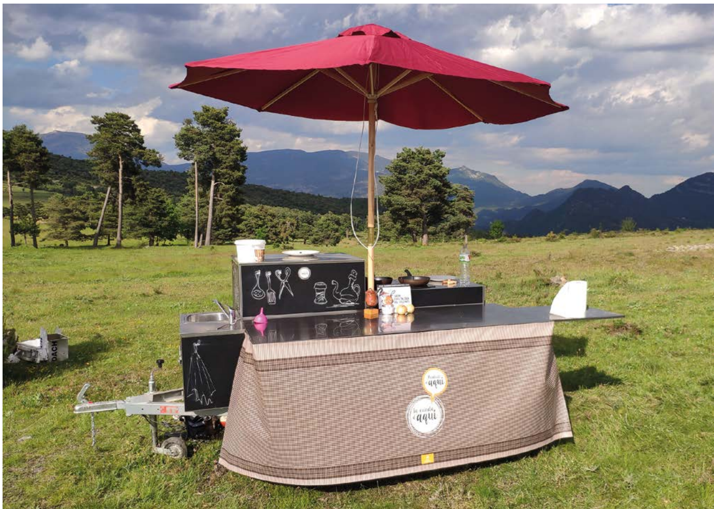
Cuineta mòbil per als tallers de cuina del projecte Producte d'aquí.

L'acció planteja que cada productor i/o elaborador agroalimentari "apadrini" un paisatge o recurs cultural del territori per enaltir d'una manera conjunta el producte agroalimentari local i el territori. S'obté un material de qualitat per l'edició i la promoció del territori; també vincularem aquest projecte i les persones que en formen part amb les seves particularitats històriques i culturals, i, evidentment, amb la imatge d'un territori rural viu. (32 fotografies)