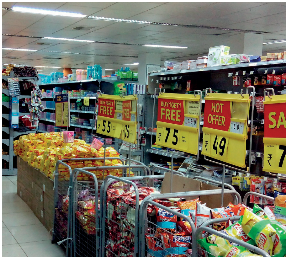
Figura 2. Ofertes d'aliments a un supermercat. Autor: P.M. Kamalakannan.

Si tractem l'aliment amb la importància que es mereix i comprem només allò que sabem que