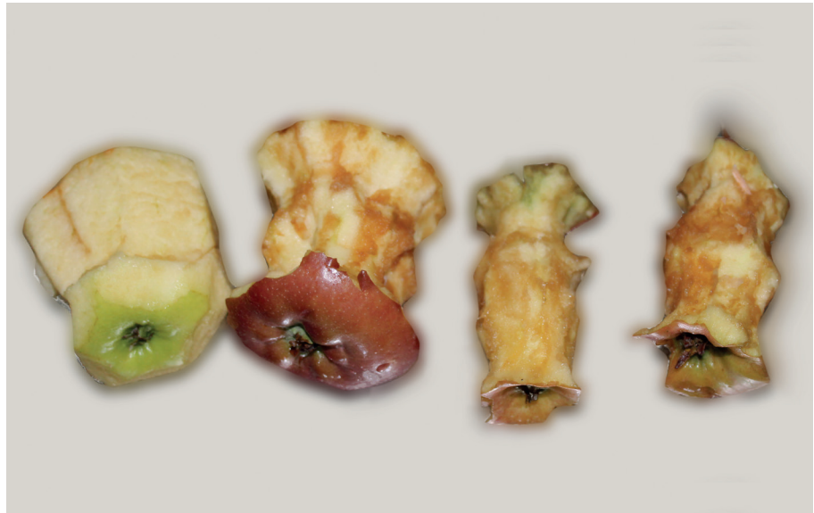
Figura 1. Comparativa de pomes rebutjades a un menjador col·lectiu. Autora: Julieth Sánchez.

Tot aquest recorregut no ha quedat exempt de controvèrsia. En aquest temps han sorgit estudis i iniciatives d'àmbits molt variats amb un bagatge i una visió del problema diferents. Avui dia conviuen enfocaments diversos. Així, veiem com els organismes internacionals han donat més rellevància o menys a les múltiples dimensions del malbaratament alimentari: la de residus, la de seguretat alimentària, la nutricional, l'ambiental o la d'accés a l'alimentació.