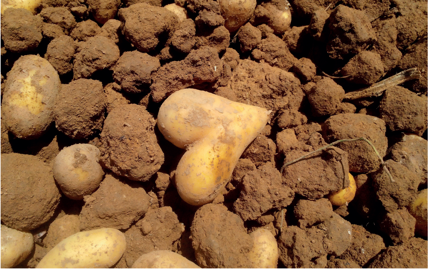
Figura 1. Estimem els aliments. Llitem contra el malbaratament alimentari. Autor: Samuel Faber

Aprofito l'oferta de dues barres per un euro. Ja tinc pa a casa, però el preu és molt temptador.