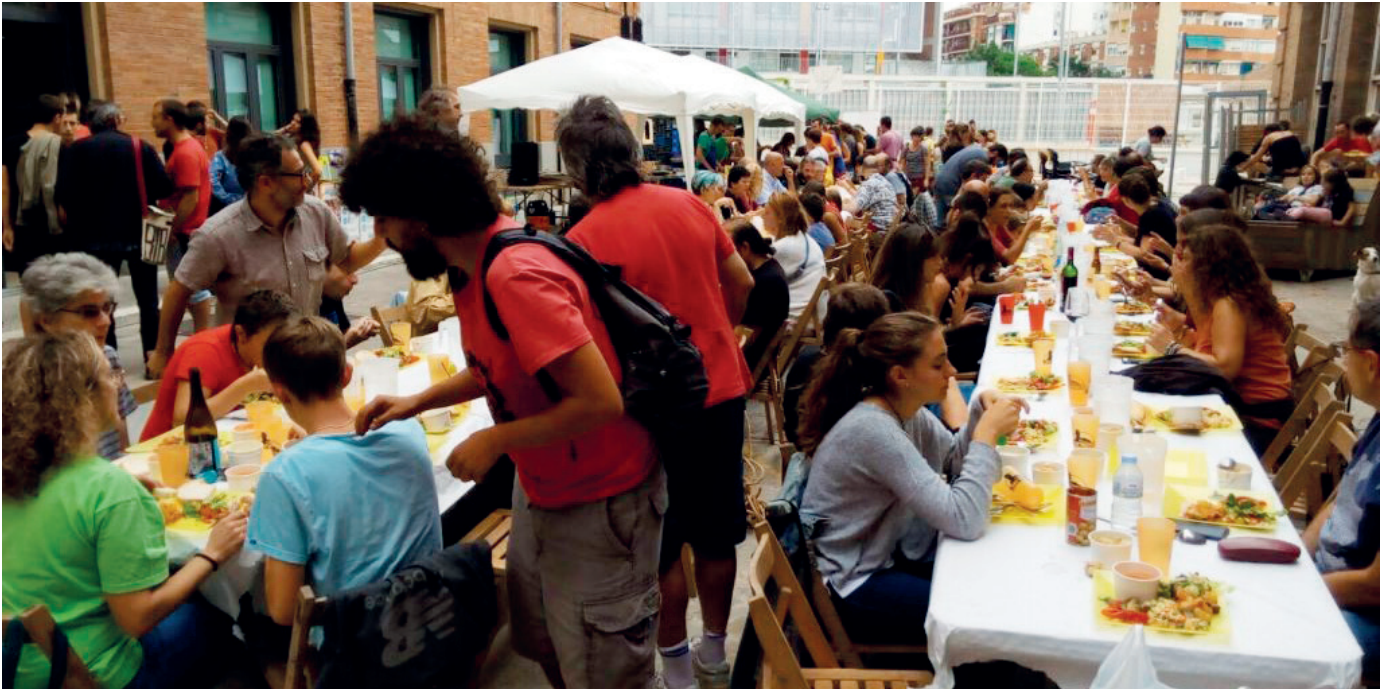
Figura 1. Dinar de sobrats a Barcelona.