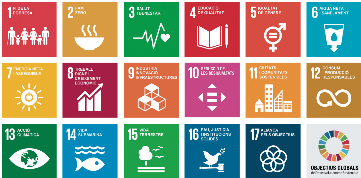
Figura 1. Objectius globals de desenvolupament sostenible. Agenda Global 2030. Font: Programa de Desenvolupament de les Nacions Unides

L'any 2050, la població mundial superarà els 9.800 milions d'habitants, amb un increment del 32% respecte de l'any 2015 (principalment als països en vies de desenvolupament). D'acord amb les dades de l'Organització de les Nacions Unides per a l'Alimentació, aquest creixement i l'augment de poder adquisitiu d'àmplies capes de la població (i el canvi de dieta que això pot comportar) fa preveure un increment del 60% en la demanda d'aliments a escala global.