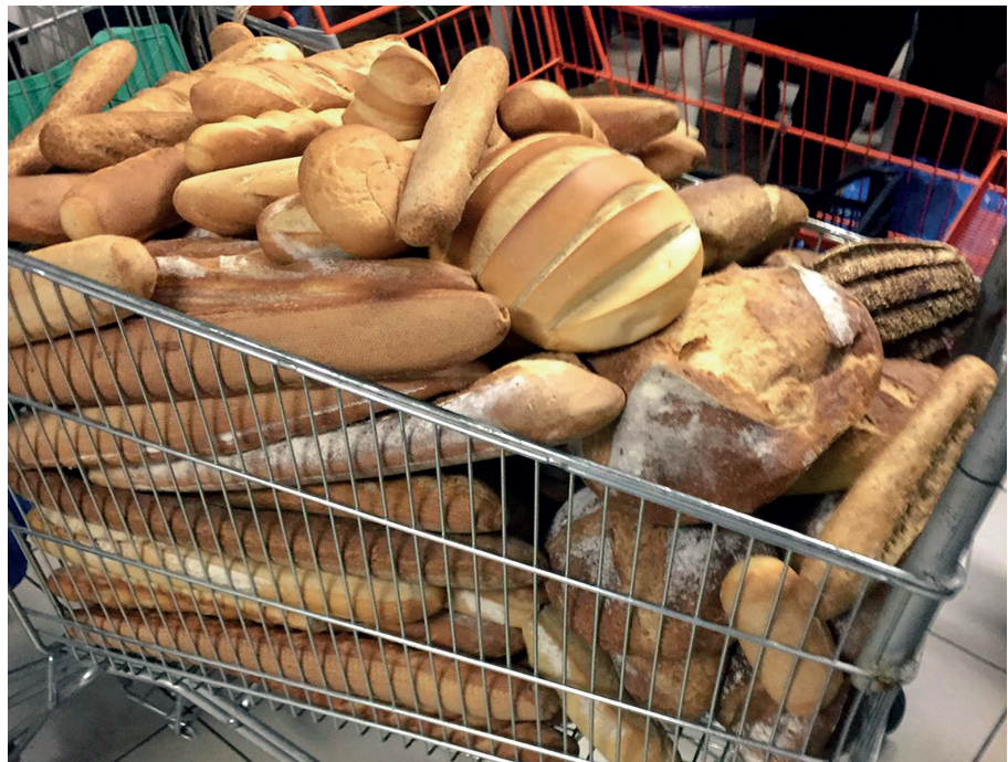
Figura 2. Pa espigolat en una botiga en un dia. Autora: Xènia Elias, col·lectiu Zero Waste Bcn.

De la mateixa manera, les solucions del malbaratament són diverses i sorgeixen des de diferents àmbits. S'ha de treballar per millorar certs comportaments incorrectes, però en el moment de definir polítiques de prevenció i reducció del malbaratament alimentari s'ha