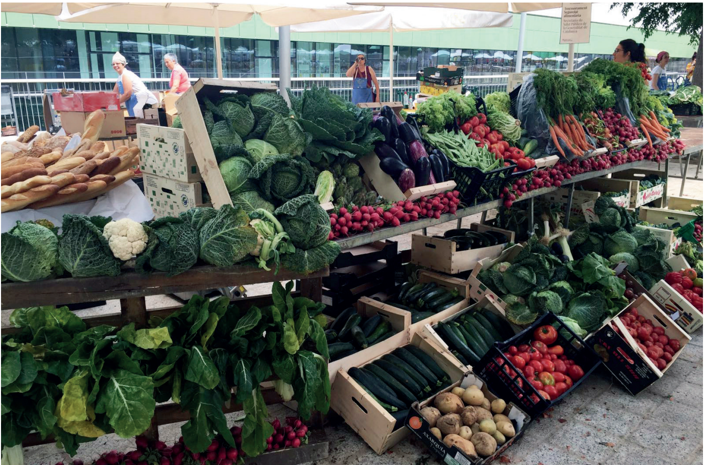
Figura 4. Parada d'adopció de fruites, verdures i pa espigolat.